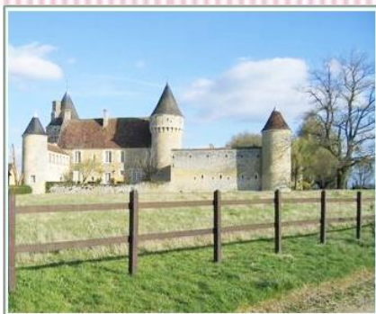
*ノルマンディー地方(イメージ)

ホームページ http://www.atelier-pelemele.com (旅のお話などご紹介しております。)