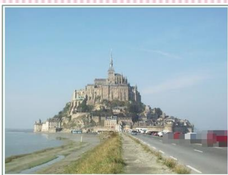
*モンサンミッシェル(イメージ)